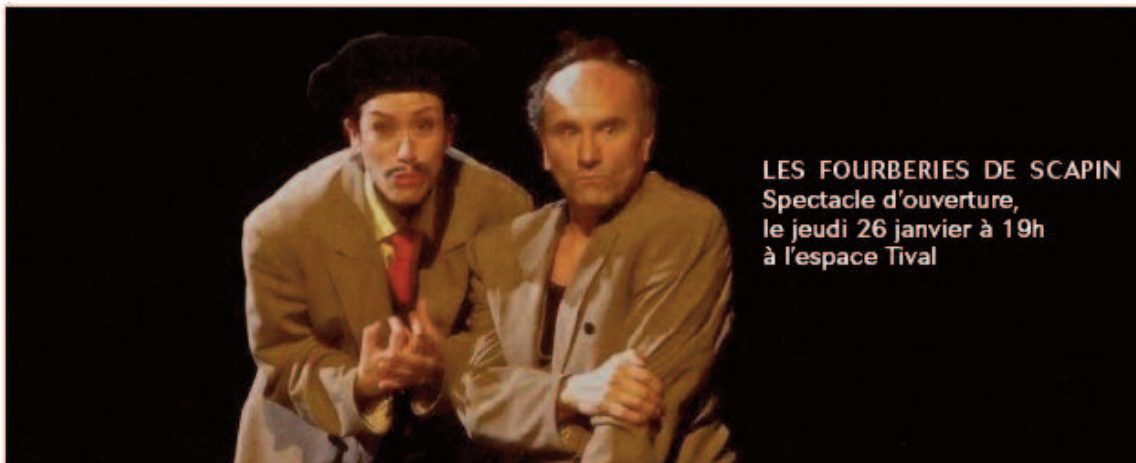
LES FOURBERIES DE SCAPIN Spectacle d'ouverture, le jeudi 26 janvier à 19h à l'espace Tival

Momix approche... Du 26 janvier au 5 février 2017, le farfelu festival rassemblera une fois encore spectateurs jeunes et moins jeunes autour d'une grande fête du spectacle vivant. Avec un état d'esprit inchangé !