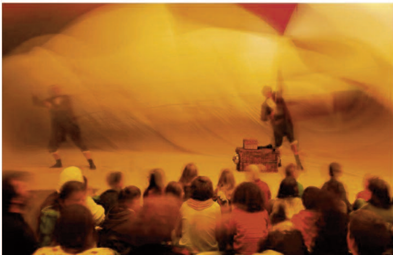
Tripula, Farrés Brothers i cía