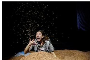
Loo , théâtre pour les plus de 2 ans par la C e Ponten Pie venue de Catalogne. C'est l'histoire poétique d'un vent chaud et sec qui repousse les dunes, assèche les mers, laissant les bateaux au milieu d'une mer de sable. Momix est aussi en balade à la Passerelle à Rixheim, le 28 janvier à 9 h 30 et 11 h.