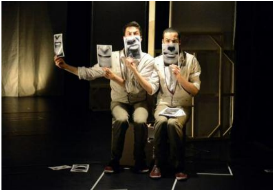
Zoom Dada , du théâtre gestuclé et hip-hop pour les plus de 4 ans, par la Bascule. Deux personnages explorent le mouvement et leur corps, à la recherche de l'inspiration pour se dessiner et dresser un portrait d'une fausse incohérence permettant de se révéler pleinement. Au Hangar à Kingsersheim, le 4 février à 10 h.

KINGERSHEIM Festival jeune public du 27 janvier au 5 février