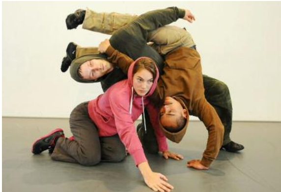
Tetris , de la danse pour les plus de 5 ans, par un quatuor dont le travail repose sur la recherche de nouvelles formes artistiques faisant fi des frontières entre les disciplines, et s'inspirant du jeu de formes Tetris. Par Arch 8, venu des Pays-Bas. À la Strueth à Kingsersheim, le 29 janvier à 10 h 30 et 16 h. DR