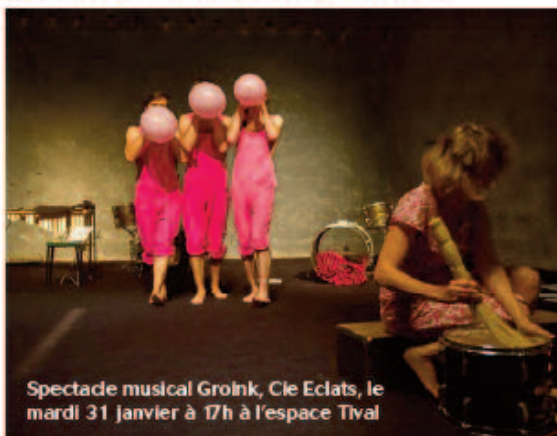
Spectacle musical Groink, Cle Eclats, le mardi 31 janvier à 17h à l'espace Tival

Une trentaine de compagnies françaises et étrangères se produiront pour remplir d'une myriade d'étoiles les yeux du public. Théâtre, danse, musique, magie, les univers se croiseront sur la scène pour créer des mondes uniques, magiques caressant l'imaginaire du spectateur.