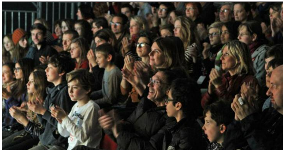
Venir à Momix en famille, c'est partager ensemble des émotions et se construire des souvenirs durables...