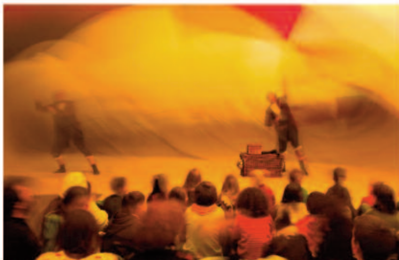
Tripula, des Farrés Brothers et Cie (Catalogne), à voir au Village des Enfants de Kingersheim.