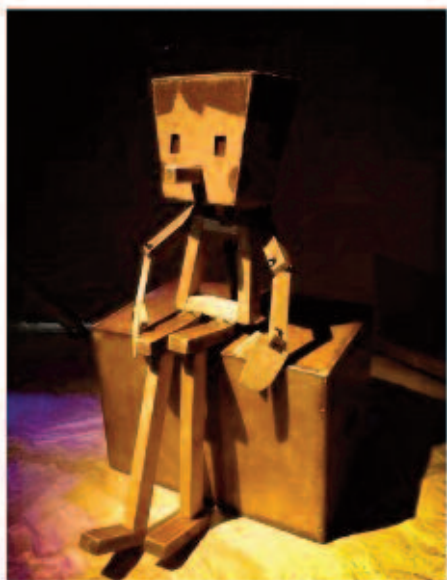
Pinocchio , de la compagnie La Baldufa

«C'est une production exigeante et originale. C'est aussi un format que nous n'avons pas l'habitude de voir dans un festival jeune public, avec 20 comédiennes au plateau», remarque le directeur de Momix qui accueille également la première création de Nino d'Introna depuis qu'il n'est plus directeur du TNG, centre dramatique national de Lyon. Parachute est une pièce écrite par le metteur en scène et à dimension autobiographique. Momix a noué un partenariat avec la scène nationale La Filature, à Mulhouse, concernant la programmation de Blanche-Neige ou la Chute du mur de Berlin , et Udo, complètement à l'Est , de la compagnie La Cordonnerie. T. L. R.