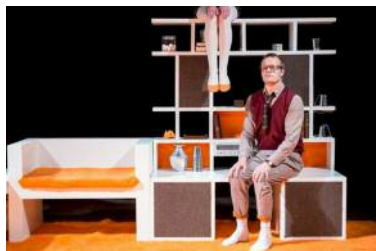
Distractions (manipulation d'objets pour les plus de 5 ans). Bien emmitouflés chez eux, dans le confort de leur quotidien, ils sont confrontés à l'ennui, à leurs manies... leurs distractions. La parole étant superflue, ce sont les corps et les objets qui s'expriment... Par le Cirque Gones, au Hangar, Kingsersheim, le 1 er février à 16 h et au Campus Fonderie le 2 à 18 h 15.