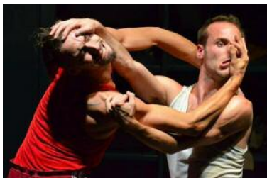
Un Poyo Royo , danse et acrobatie pour les plus de 12 ans, par le Teatro fisico, venu d'Argentine. Dans les vestiaires d'une salle de sport, deux êtres se cherchent, se jaugent, se désirent, se rejettent pour une expérience sensorielle étonnante laissant aux spectateurs toute latitude d'interprétation. À l'Espace Tival de Kingsersheim, le 28 janvier à 20 h 30.

Comme l'an passé, Momix s'associe à Clowns sans fron- tières et donne 0,50 € par entrée à cette association pour l'enfance en situation de grande difficulté.