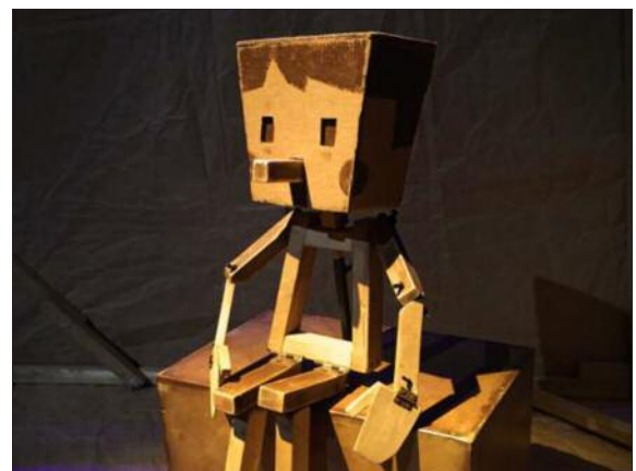
« Pinocchio », l'une des cinq propositions catalanes.