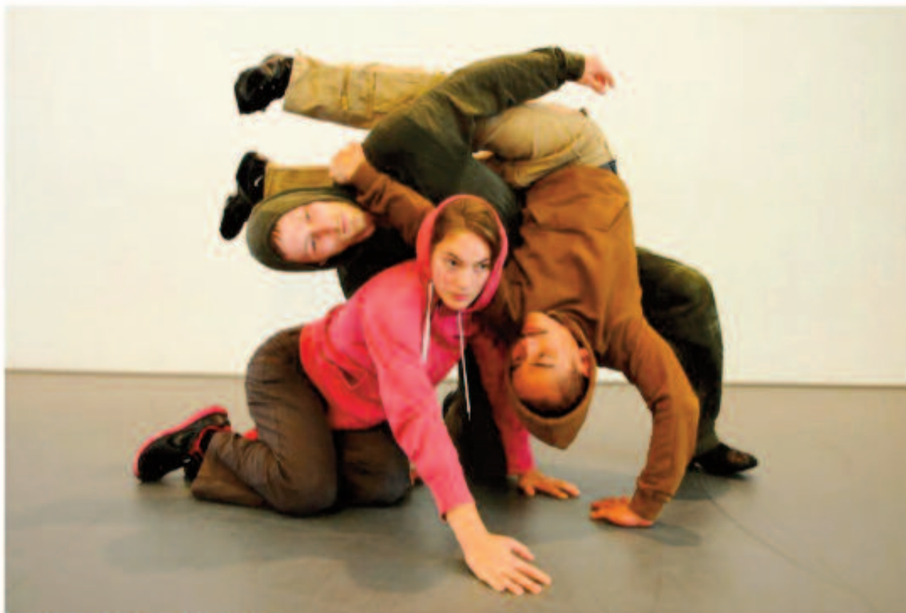
Visuel - Le spectacle Tetra , présenté au festival Momix Foto: Ole Show „Tetra“ beim Festival Momix