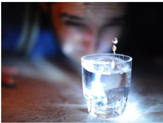
Dans ma tête , du théâtre pour les plus de 7 ans par la C e Entre eux deux rives. C'est l'histoire de Romain, qui n'est pas comme les autres. Sa vie est faite de rituels qui le rassurent. La question de la différence abordée avec poésie et sensibilité. Au Hangar à Kingsersheim, le 28 janvier à 14 h. DR

Momix, c'est chaque année une quarantaine de compagnies professionnelles invitées, et « des spectacles où se croisent toutes les disciplines (théâtre, danse, musi-que, marionnettes, etc.), choisis pour leur exigence de qualité, sur le fond et sur la forme, en même temps que pour leur accessibilité à tous les publics ». C'est un festival qui défend la création artistique, un festival local, régional, national et international avec une programmation 2017 elle-même internationale, les compagnies venant des quatre coins du monde pour présenter leurs spectacles (Argentine, Bel-gique, Espagne, Italie, Pays-Bas, Québec...), un festival devenu une référence dans le domaine du spectacle jeune public. Cette année, 34 compagnies pro-