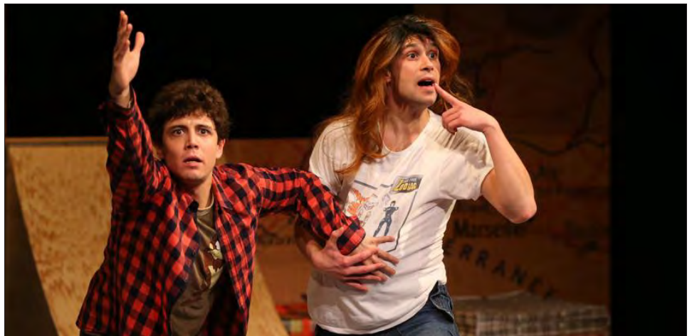
« Arthur et Ibrahim », présenté en séance publique dimanche après-midi et lundi en scolaire.