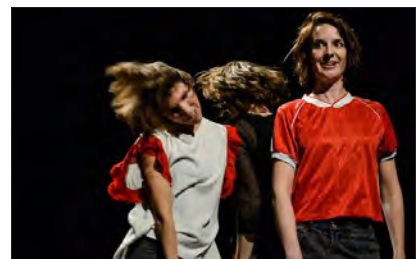
« Des illusions », de la compagnie belge 3637, première très belle surprise de cette édition 2018, le 2 février à la salle de la Strueth.