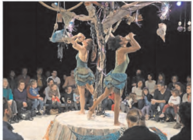
« Woesj », un joli voyage sur une île minuscule où chantent les coquillages.

SE RENSEIGNER Le festival se poursuit jusqu'au 11 février. Renseignements : www.momix.org/fr/