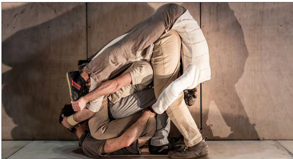
Le festival s'ouvre jeudi soir avec le spectacle « Intarsi » de la compagnie catalane Eia (cirque, + 6 ans).

Là, on est dans une esthétique très différente. Chez les Flamands, il y a un travail sur le corps, des productions qui associent des enfants comme Horses . On est dans une approche très contemporaine, déca-