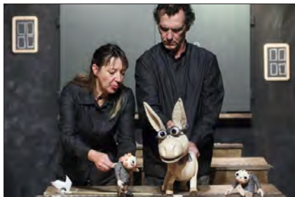
« Du vent dans la tête », création du Bouffou, ce samedi à 10 h et 15 h 30.

« Scapin et la fortune du pot » a été programmé à Momix en 2000.