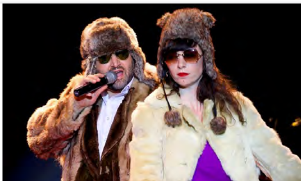
Médina Mérika, samedi 10 février à la salle de la Strueth de Kingersheim, dès 13 ans.