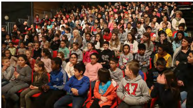
À Momix, les séances scolaires font également le plein.