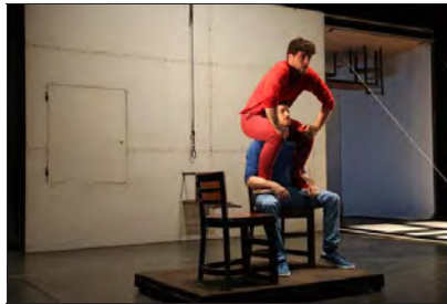
Last but not least, « Les idées grises » de la Cie Barks a provoqué une standing ovation, hier soir, à l'Espace Tival.