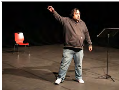
Moment fort et singulier de ce 2 e week-end de Momix, « Ce que j'appelle oublié », la restitution sobre et vibrante du très beau texte de Laurent Mauvignier, librement inspiré d'un fait divers lyonnais. Le passage à tabac mortel d'un jeune homme coupable d'avoir consommé une canette de bière dans un supermarché, coupable de vivre...