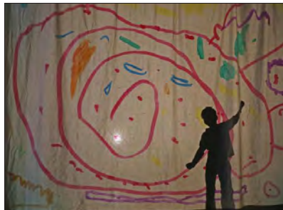
Quentin s'est amusé à « voler » dans son labyrinthe coloré.