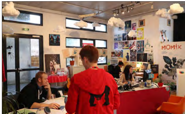
Dans le hall du Créa, la billetterie a installé son quartier général. Go !

Sans compter les nombreux intermittents qui assurent tout l'accompagnement des spectacles. Compte tenu de la multiplicité des sites (Espace Tival/Creà/Salle Cité-Jardin, Salle de la Strueth, Village des enfants/Sneds) et du grand nombre de représentations, pas le temps de chômer... Il faut aussi préparer quotidiennement les repas pour toutes les compagnies, artistes et techniciens, etc.