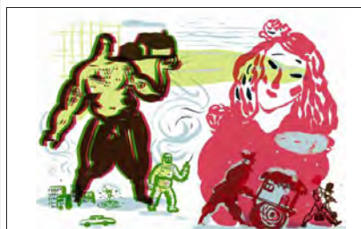
Gerda Dendooven, une des artistes flamandes accueillies à la bibliothèque de Mulhouse.

Programmation : la programmation du festival Momix 2018 est disponible sur le site www.momix.org Réservation par téléphone : 03 89 50 68 50 (ligne spéciale festival). Par courriel : billetterie@momix.org ou au Créa, 27, rue de Hirschau à Kingersheim. Billetterie ouverte du lundi au vendredi de 14 h à 18 h, le mercredi de 10 h à 12 h (fermé du 23 décembre au 7 janvier). Tarifs : de 5,50 € à 12 € (voir détails sur le site). La cigogne, monnaie locale, acceptée.