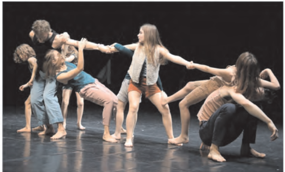
Le spectacle « Horses », hier après-midi à l'Espace Tival : une ode à l'enfance, un plaidoyer pour la tendresse.

Quatre enfants, quatre adultes. Au tout début, ils forment une chaîne humaine mouvante qui jamais ne se casse. Toujours en contact, toujours liés et reliés par une énergie qui circule entre les corps, les petits portés par les grands, rampant sur une épaule, s'enroulant autour d'une taille, glissant précautionneusement le long d'une jambe pour venir toucher le sol en douceur. Jeux d'enfants, gestes protecteurs d'adultes bienveillants, échanges de regards intenses, confiance absolue. Les enfants communiquent aux adultes la fraîcheur et la fougue de leur âge, les adultes leur prodiguent une attention de tous les instants, saisissent chaque proposition au vol. Mus par la certitude qu'il ne peut rien leur arriver, les enfants affichent une liberté invulnérable, sans jamais douter que l'adulte sera toujours là pour réceptionner une chute, les porter affectueusement, entrer dans la danse... L'adulte est à la fois le refuge et le tremplin. Celui qui