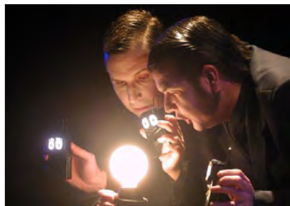
« Nosferatu », présenté à Momix en 2004 et en 2011.