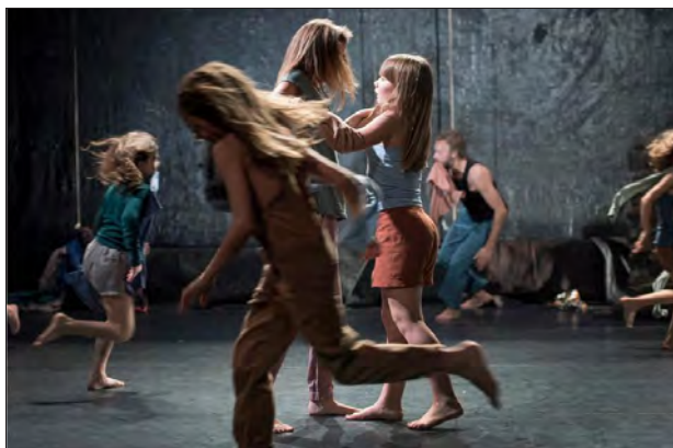
« Horses », spectacle dansé venu des Flandres, pour parler de l'énergie de l'enfance.

Bon nombre de spectacles racontent l'état du monde, ses félicités et ses résistances. Des spectacles pour éveiller les sensibilités, se