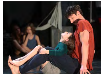
Coup de cœur de ce festival, « Horses », une histoire dansée de tendresse et d'attention qui raconte un peu la relation idéale entre les enfants et le monde des adultes.