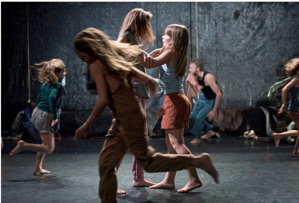
Horses de la Cie belge Kabinet K & Hetpaleis est un véritable plaidoyer pour l'attention à l'autre et la liberté, dansé par cinq enfants et cinq adultes.