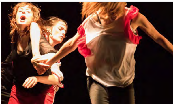
Des illusions, vendredi 2 février à la salle de la Strueth de Kingersheim, dès 12 ans. DR

THÉÂTRE JEUNE PUBLIC A Kingersheim du 1 er au 11 février