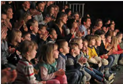
Applaudissement chaleureux et yeux qui brillent après la représentation de « Du vent dans la tête », création du Bouffou théâtre.