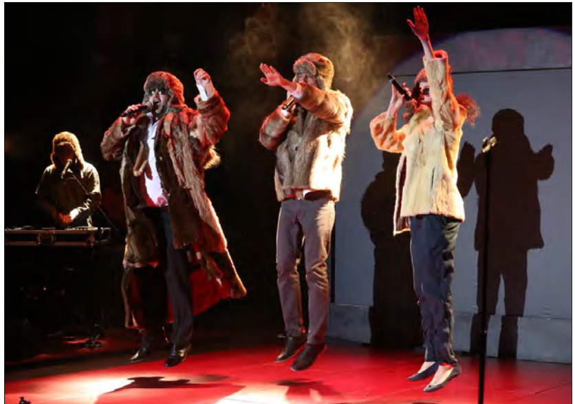
« Medina Mérika », des chiens qui parlent et qui chantent du rock oriental décoiffant...

LIRE AUSSI Les prix du festival Momix 2018 en pages Région.