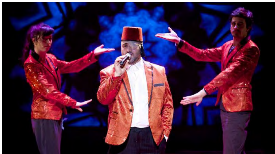
Le prix du Jury Momix 2018 a été décerné à Médina Mérika, théâtre musical, par la Compagnie Nomade in France.