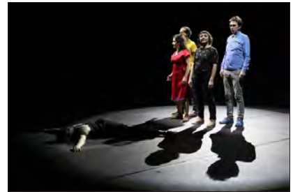
« De l'avenir incertain du monde merveilleux dans lequel nous vivons », la dernière création du Bob, écrite... en pleine ascension macroniste !