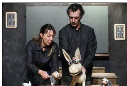
Parmi les créations, « Du vent dans la tête » du Bouffou théâtre.