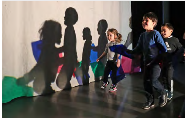
Après avoir dansé et joué dans leur dessin, les enfants ont participé à un grand bal collectif...