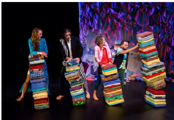
Frusque(s), mercredi 7 février à l'Espace Tival de Kingersheim, dès 6 ans.

Enfin, Momix est également entré dans divers réseaux régionaux, étant aussi devenu, « un lieu de repérage » dans différentes régions, « une vitrine » à l'attention des professionnels, avance Philippe Schlienger, le directeur du festival... Ainsi Momix a lancé l'an dernier avec la Catalogne, les focus vers d'autres régions. En 2018, ce sera la Belgique, avec Momix à la flamande et la Bretagne, avec Glaz Kids, la Bretagne à Momix . L'occasion de mettre en avant des compagnies, des spécifici-