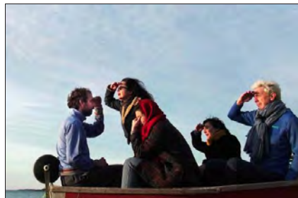
« De l'avenir incertain... », création du Bob, ce dimanche à 17 h.