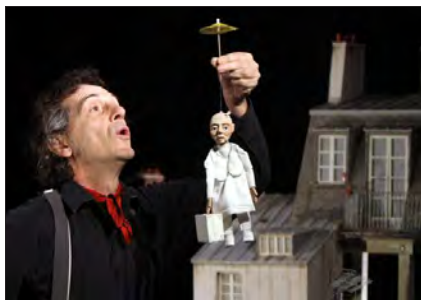
« Toi du monde » du Bouffou, prix Momix en 2015

Serge Boulier : Je n'ai pas eu de désir de théâtre, petit. Ce sont les rencontres... À la sortie de l'école, j'avais le choix entre bosser comme technicien pour une grande marque française de pneus ou entrer aux Beaux-arts à Nantes. Mes parents ont eu le courage de me laisser le choix... Je suis allé aux