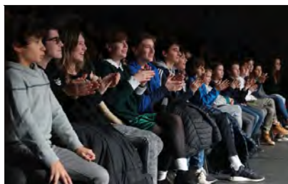
Hier après-midi, le « Jury des juniors » était au premier rang pour découvrir la dernière création du Bob théâtre.